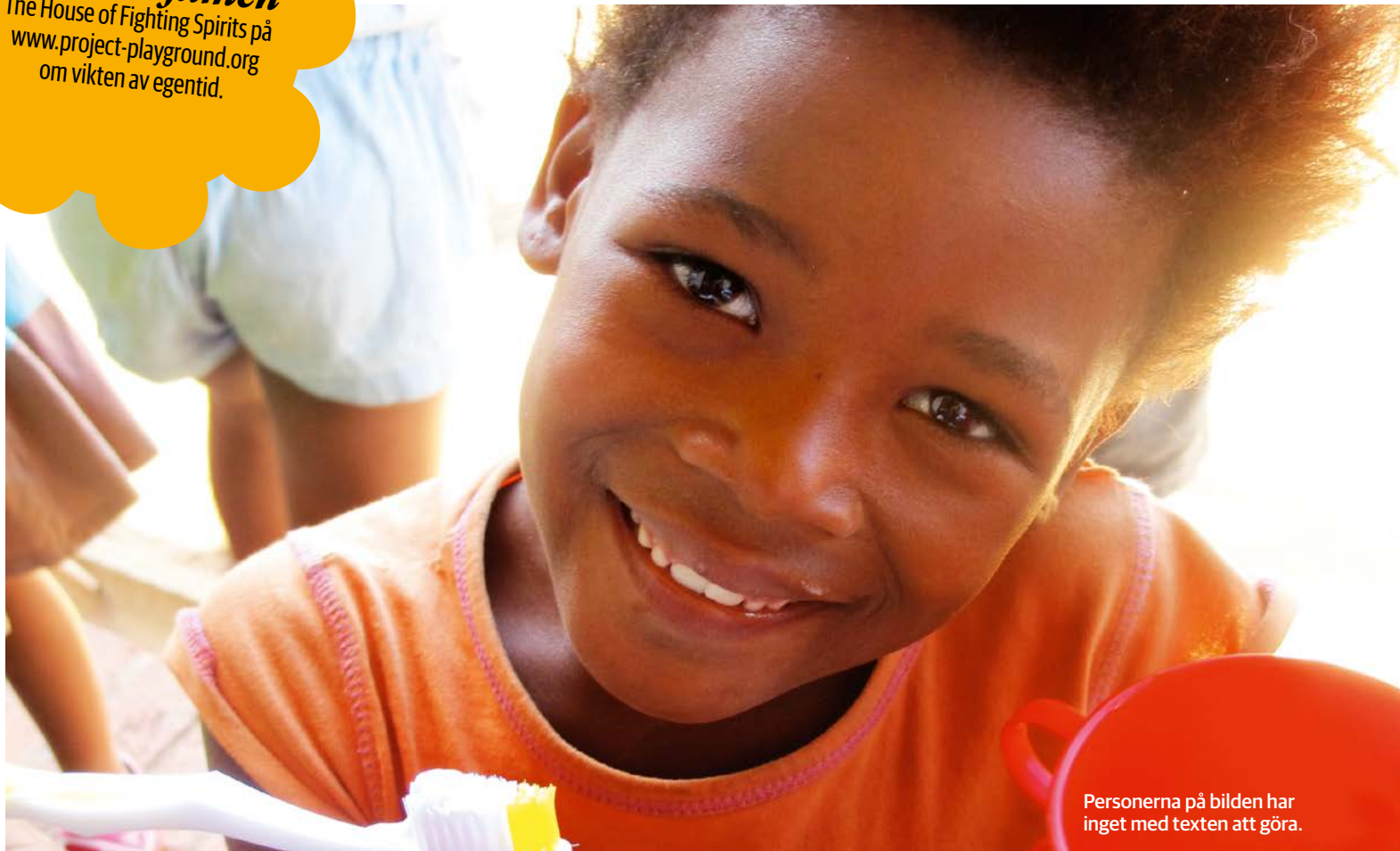
Personerna på bilden har inget med texten att göra.

Se gärna filmen The House of Fighting Spirits på www.project-playground.org om vikten av egentid.